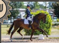
Bon Courage Bon Coeur-Vivaldi