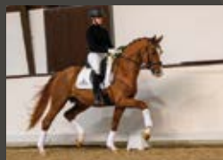
Forte per me For Romance I OLD - De Niro