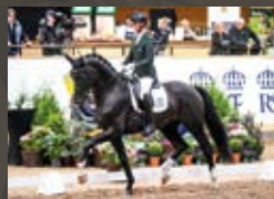
Skyline To B Blue Hors St. Schufro - Ampere

Dressurpferde Leistungszentrum Lodbergen GmbH Zum Jägerack 2, 49624 Lönningen/Lodbergen, Germany T +49-5432-5959460, F +49-5432-59594699, info@dressurleistungszentrum.de www.dressurleistungszentrum.de