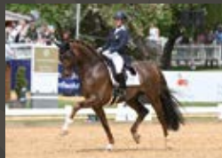
La Vie Livaldon - Scolari