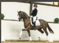
Juwel Janeiro Platinum - Sir Donnerhall I