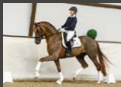
Bellany Bon Coeur - De Niro