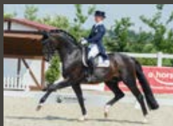
For Romance I OLD Fürst Romancier - Sir Donnerhall I