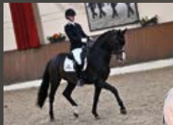
Rock For Me Rock Forever I - Florencio I